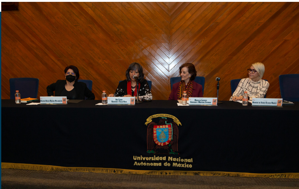
Presentación en la Dirección General.

De preparatorianos y sobre la Preparatoria